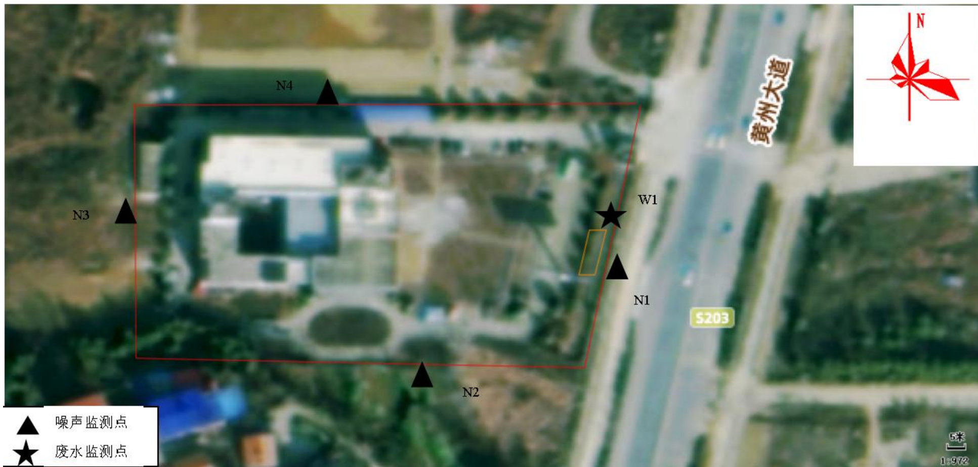
附图 5 监测点位图