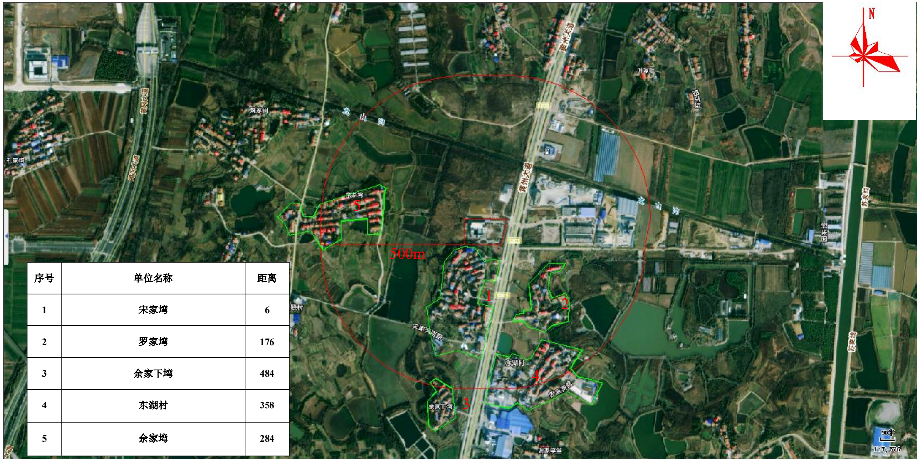
附图 2 项目周边关系示意图