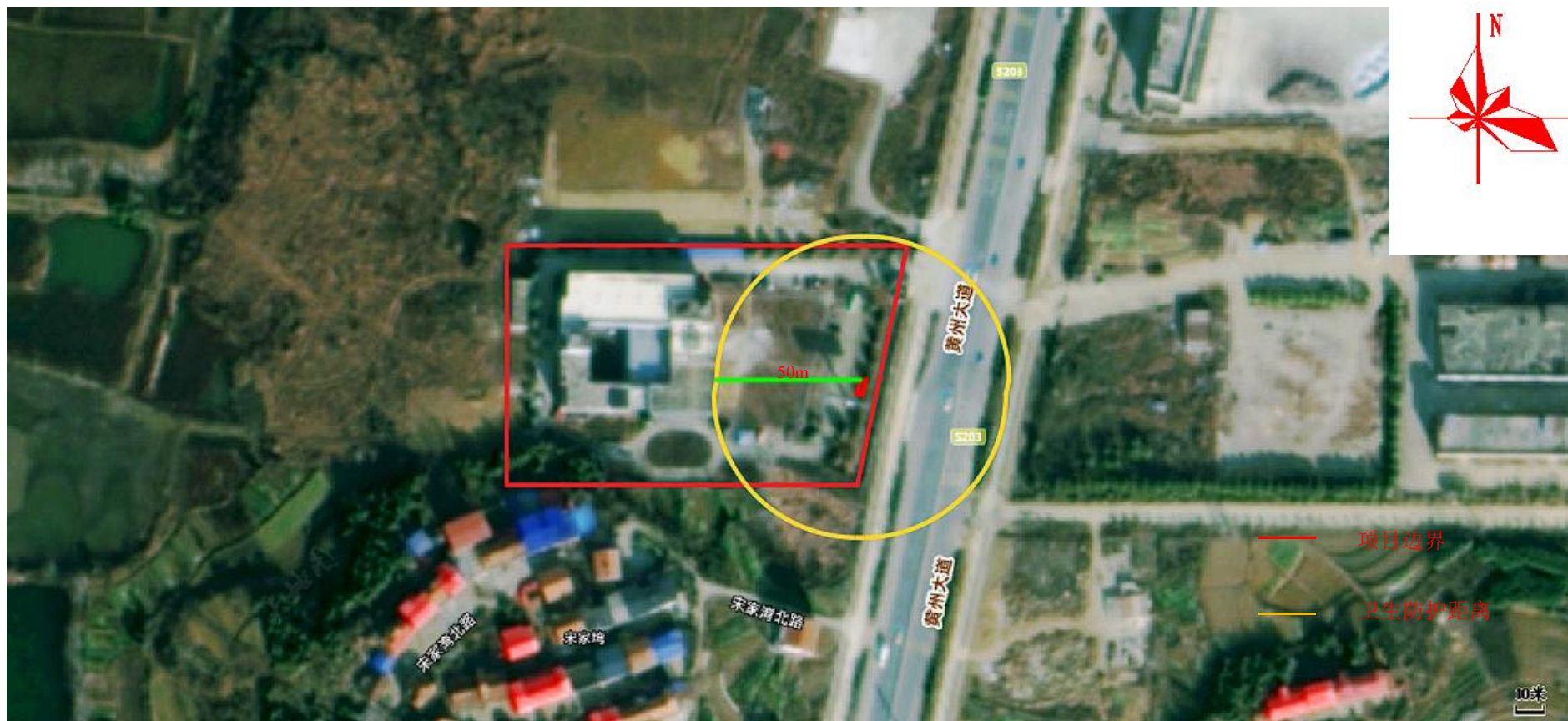
附图4 卫生防护距离图