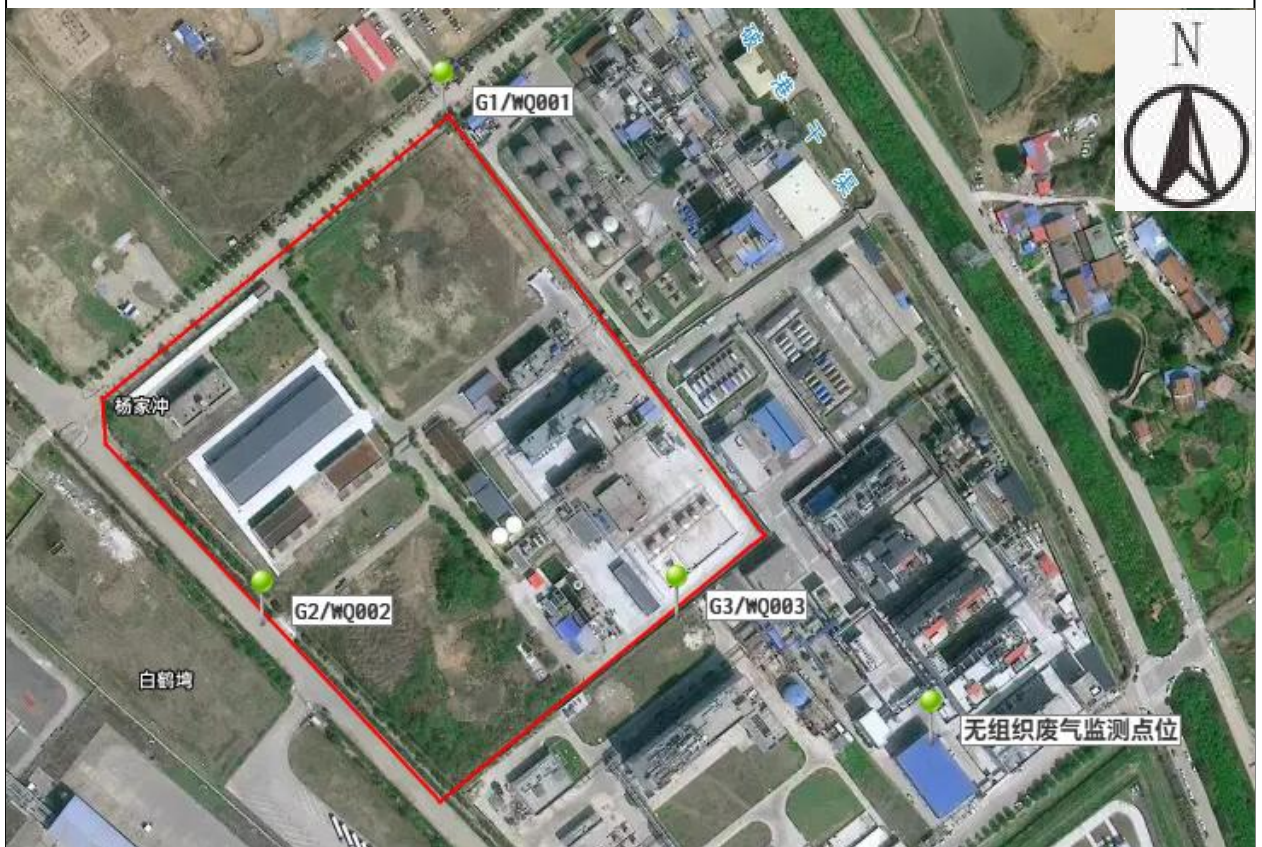
附图 6 项目验收监测点位图（无组织废气监测点位）