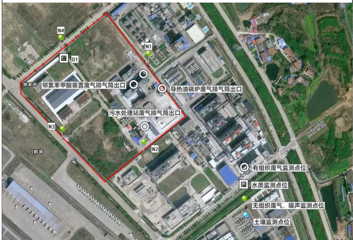
附图 7 项目验收监测点位图