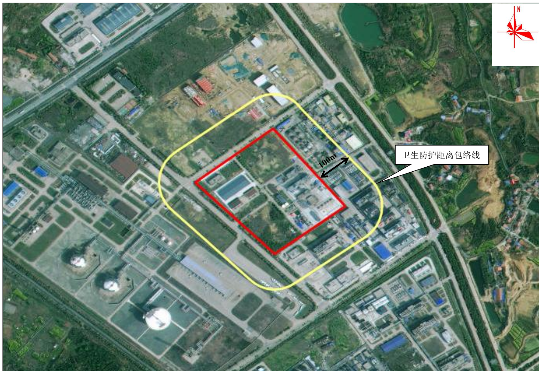
附图 8 项目卫生防护距离包络线图