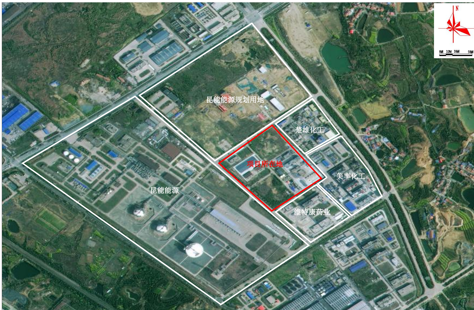
附图2 项目周边关系示意图