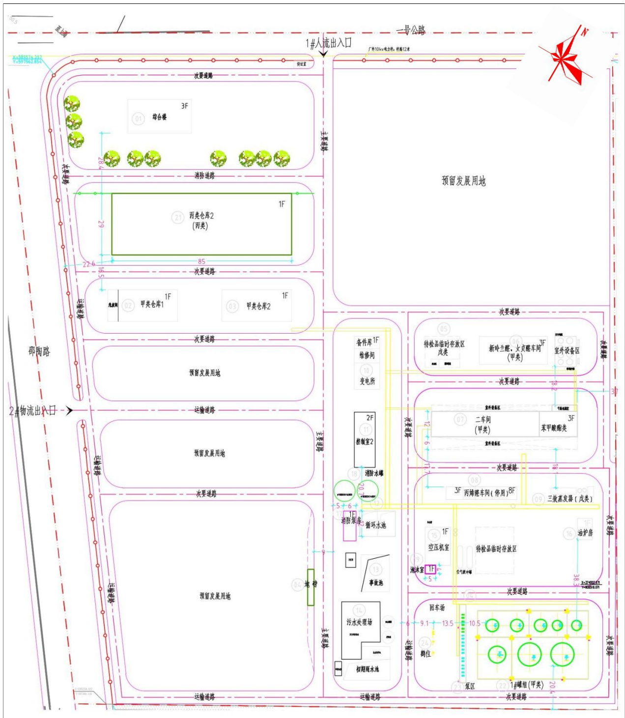
附图3 项目厂区平面布置图