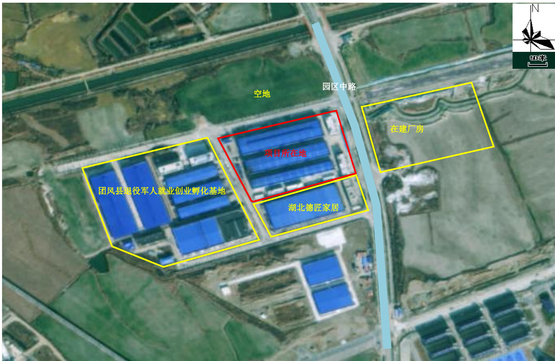
附图2 项目周边关系示意图