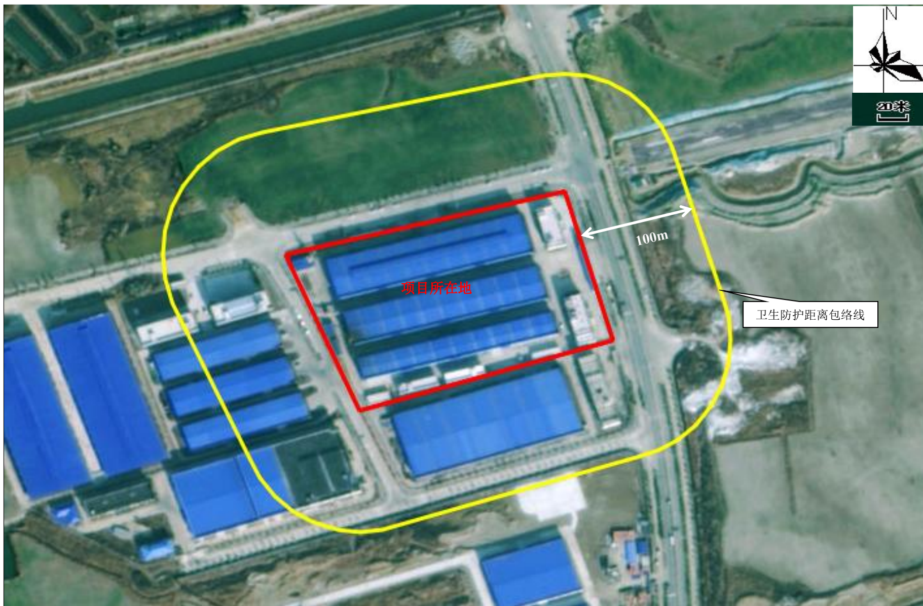
附图 5 项目卫生防护距离包络线图