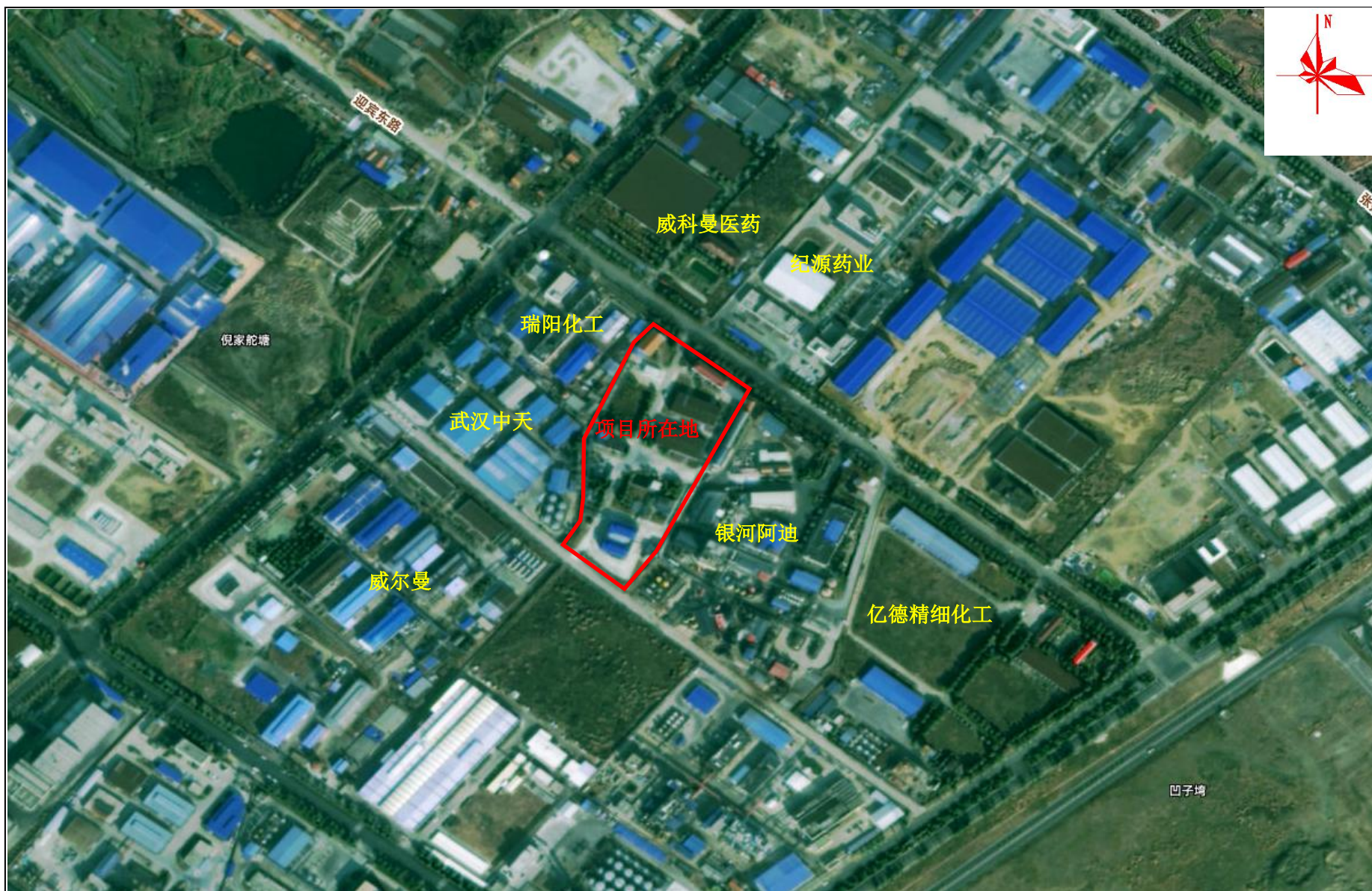
附图2 项目周边关系示意图