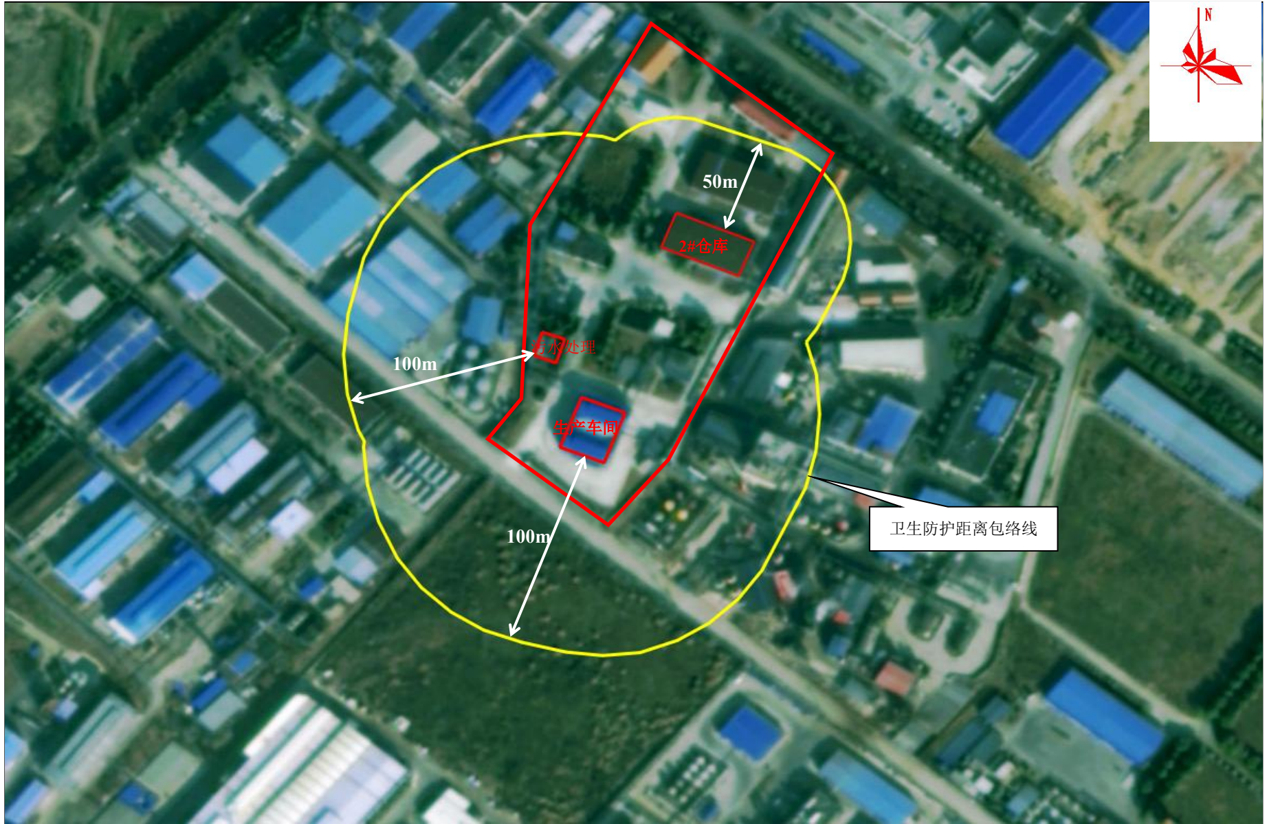
附图 6 项目卫生防护距离包络线图