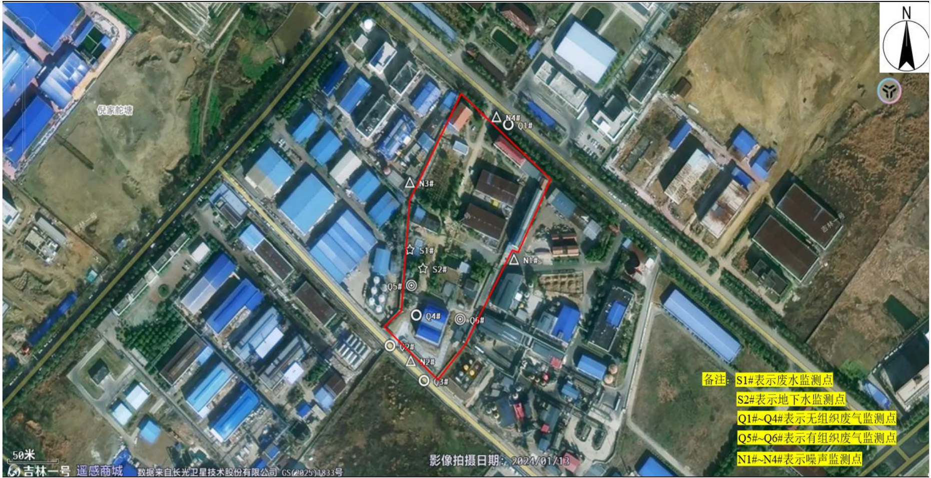
附图5 项目验收监测点位图