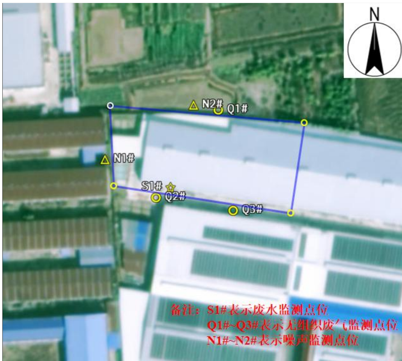
附图4 项目验收监测点位图