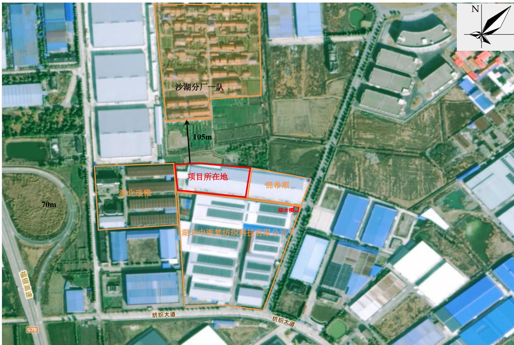
附图 2 项目周边关系示意图