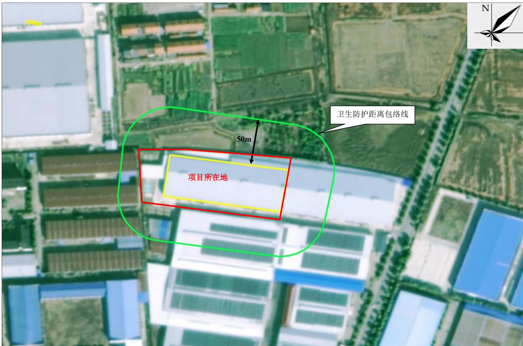
附图5 项目卫生防护距离包络线图