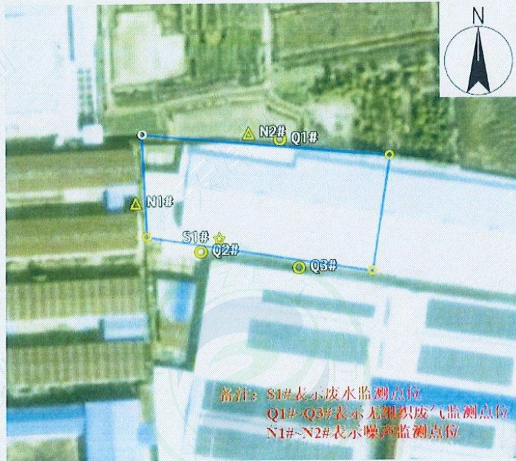
附图 1：监测点位示意图