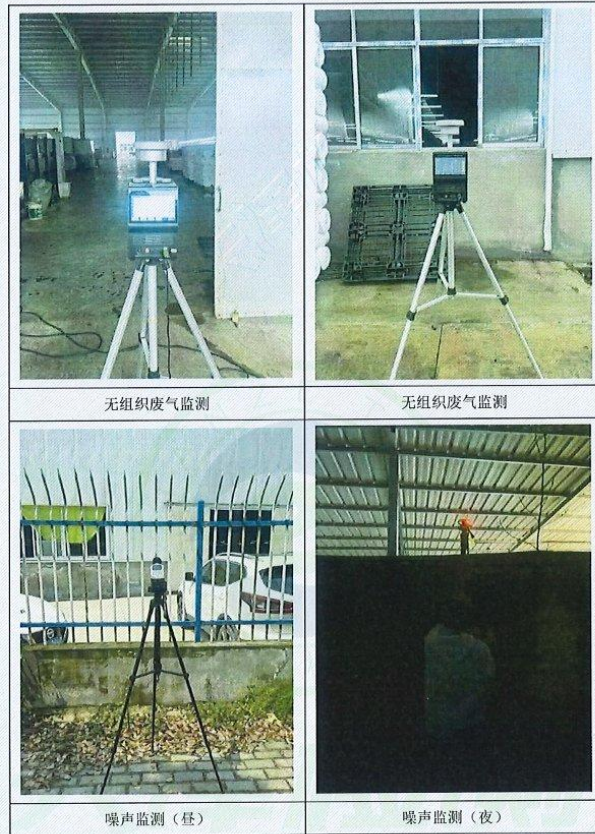
附图 2：现场采样照片