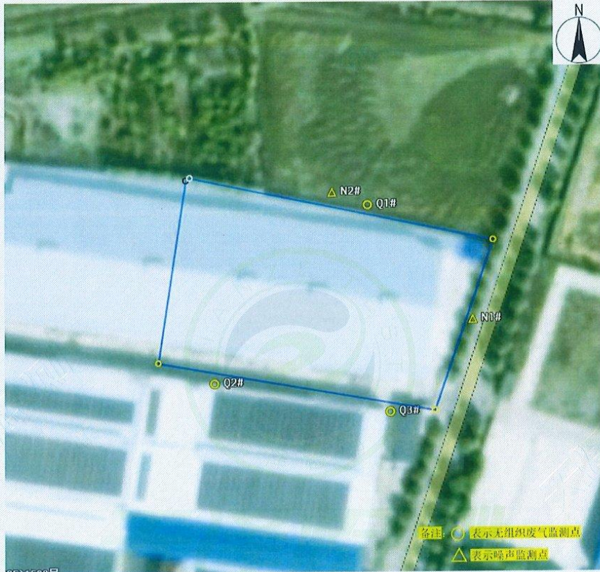
附图 1：监测点位示意图