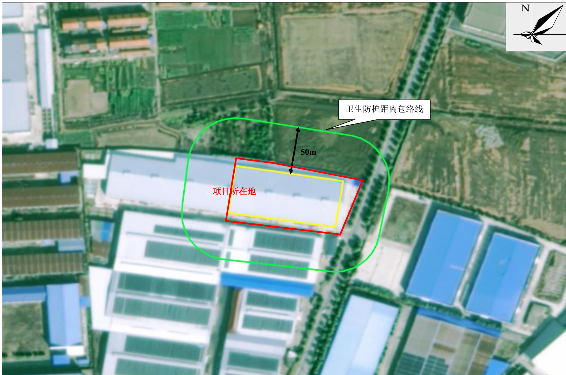
附图5 项目卫生防护距离包络线图