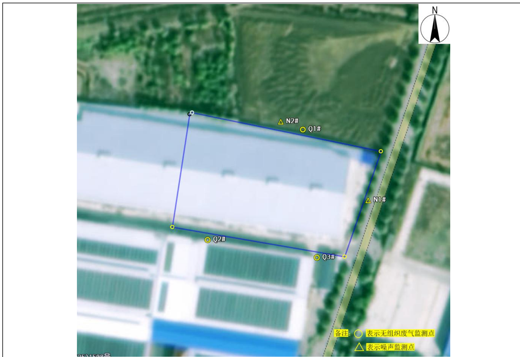
附图4 项目验收监测点位图