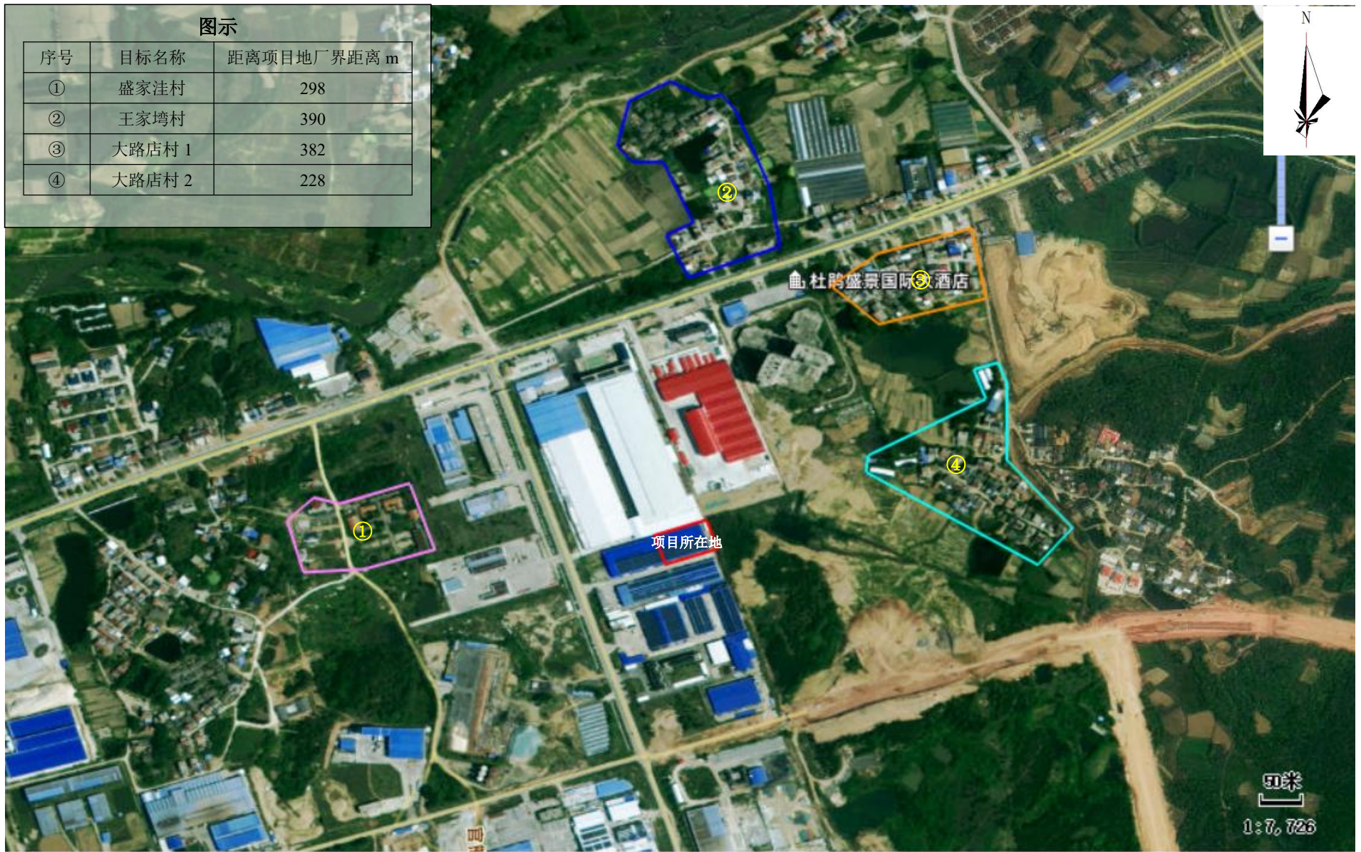
附图 2 项目周边关系图