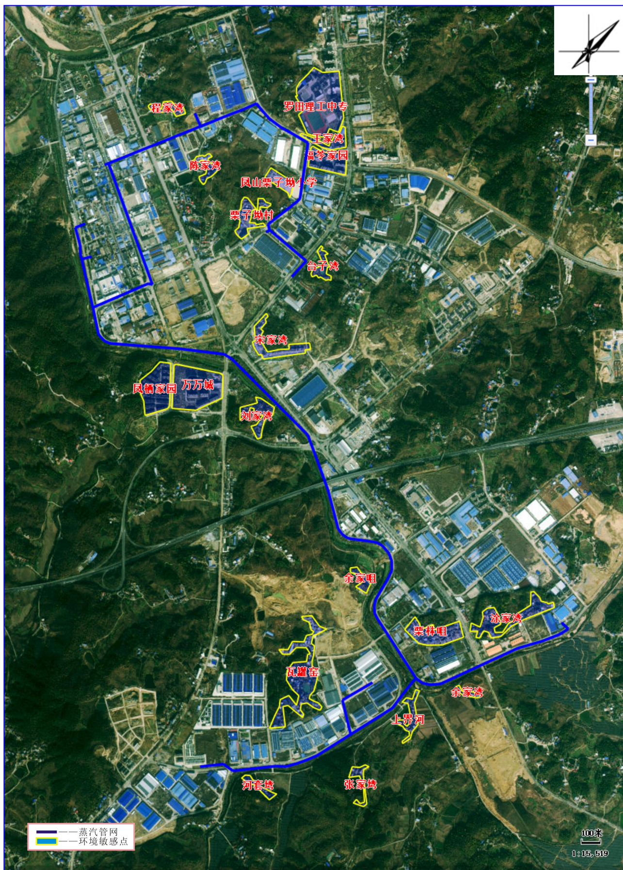
附图4 项目蒸汽管网周边环境关系图