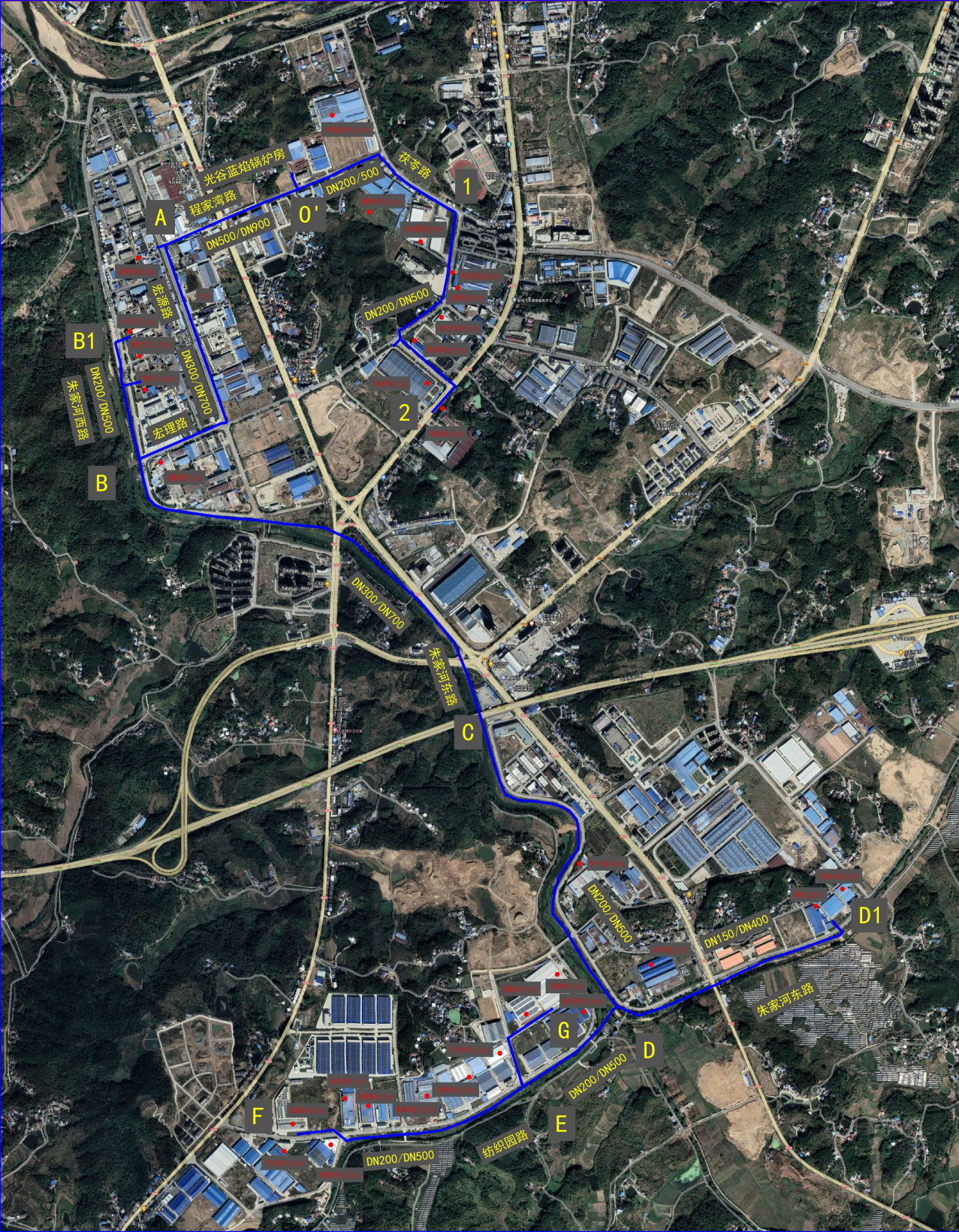
附图 8 项目蒸汽管网布置图