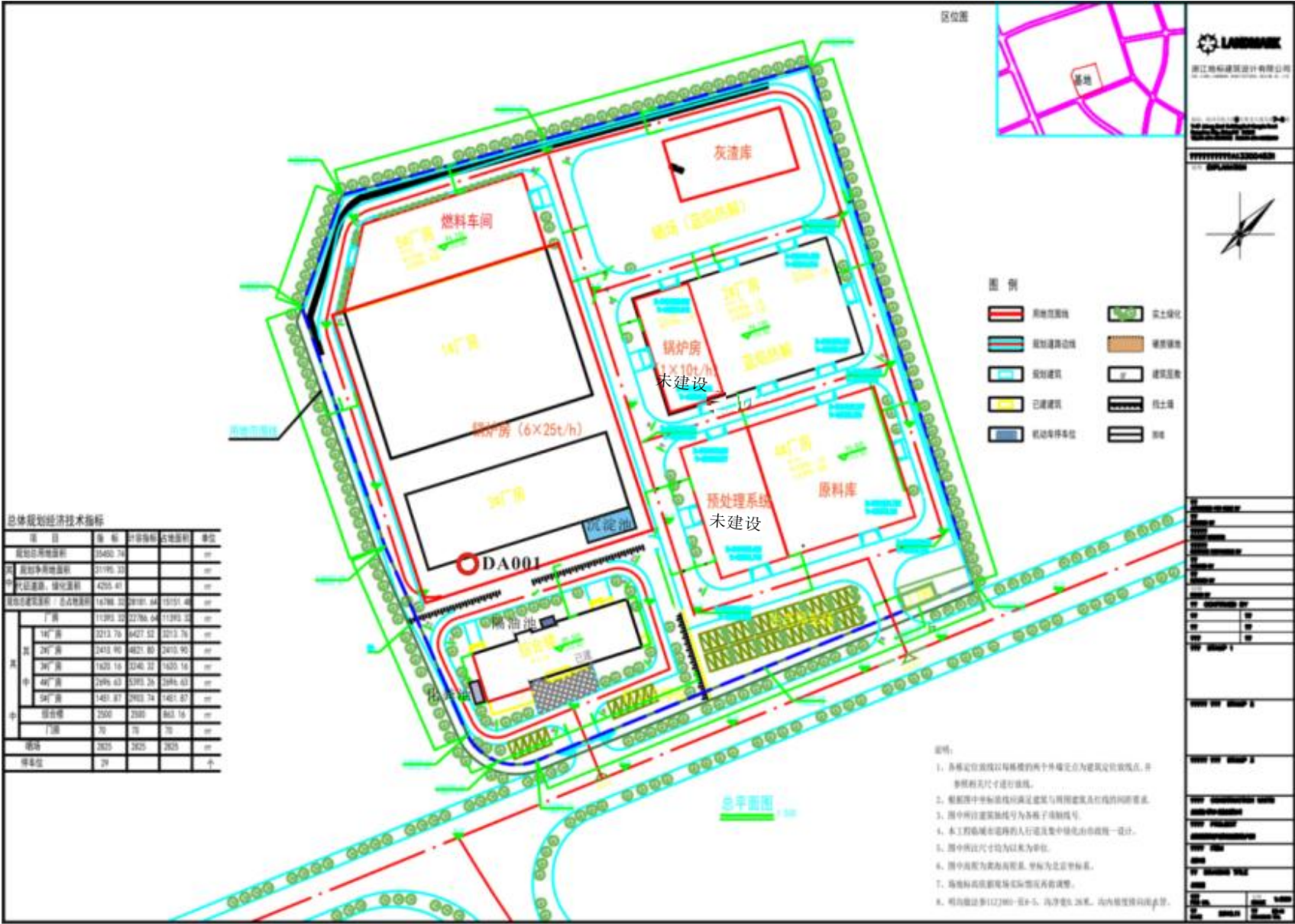
附图6 项目厂区平面布置图