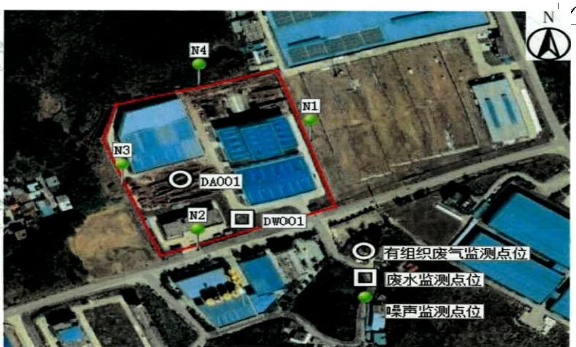
附图 5 验收监测点位图