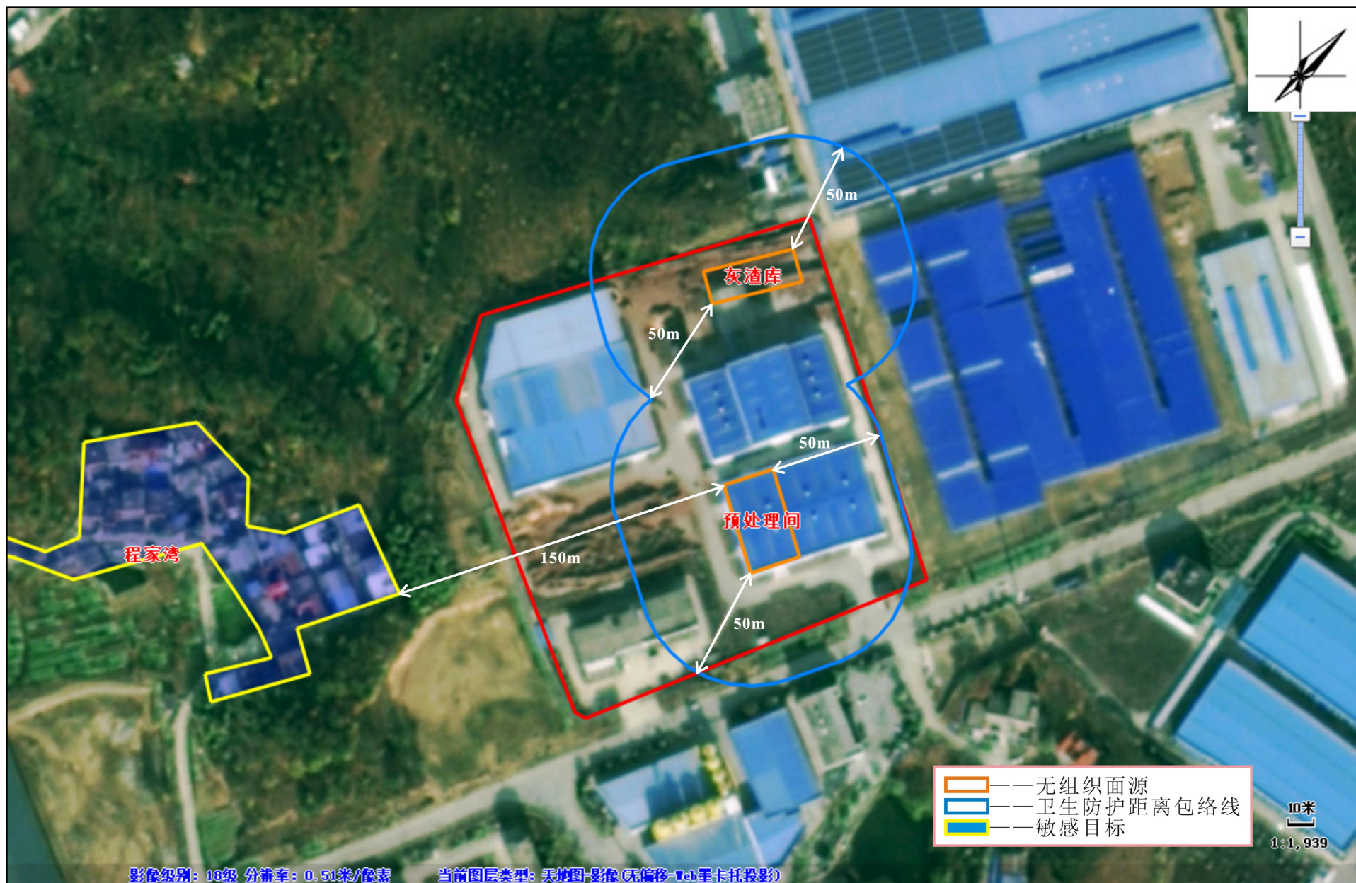
附图2 卫生防护距离包络线