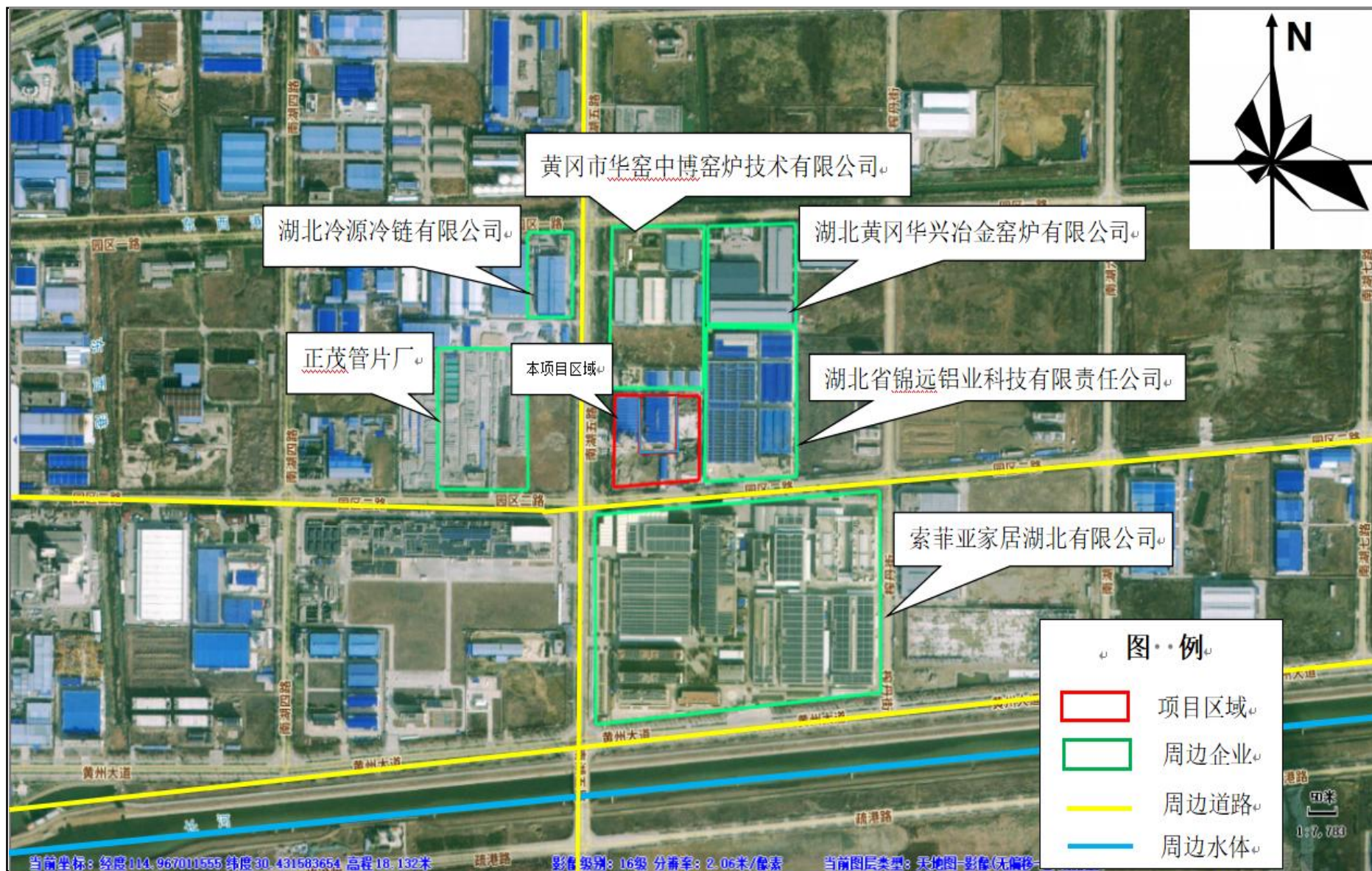
附图2 项目周边环境关系示意图