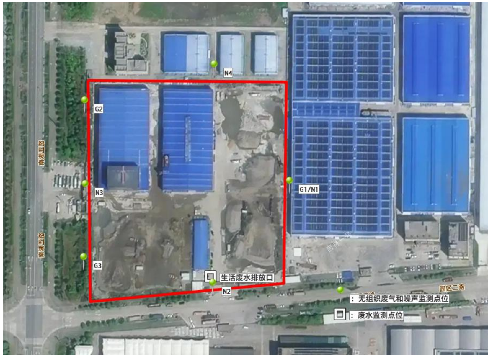
附图 4 项目监测点位图