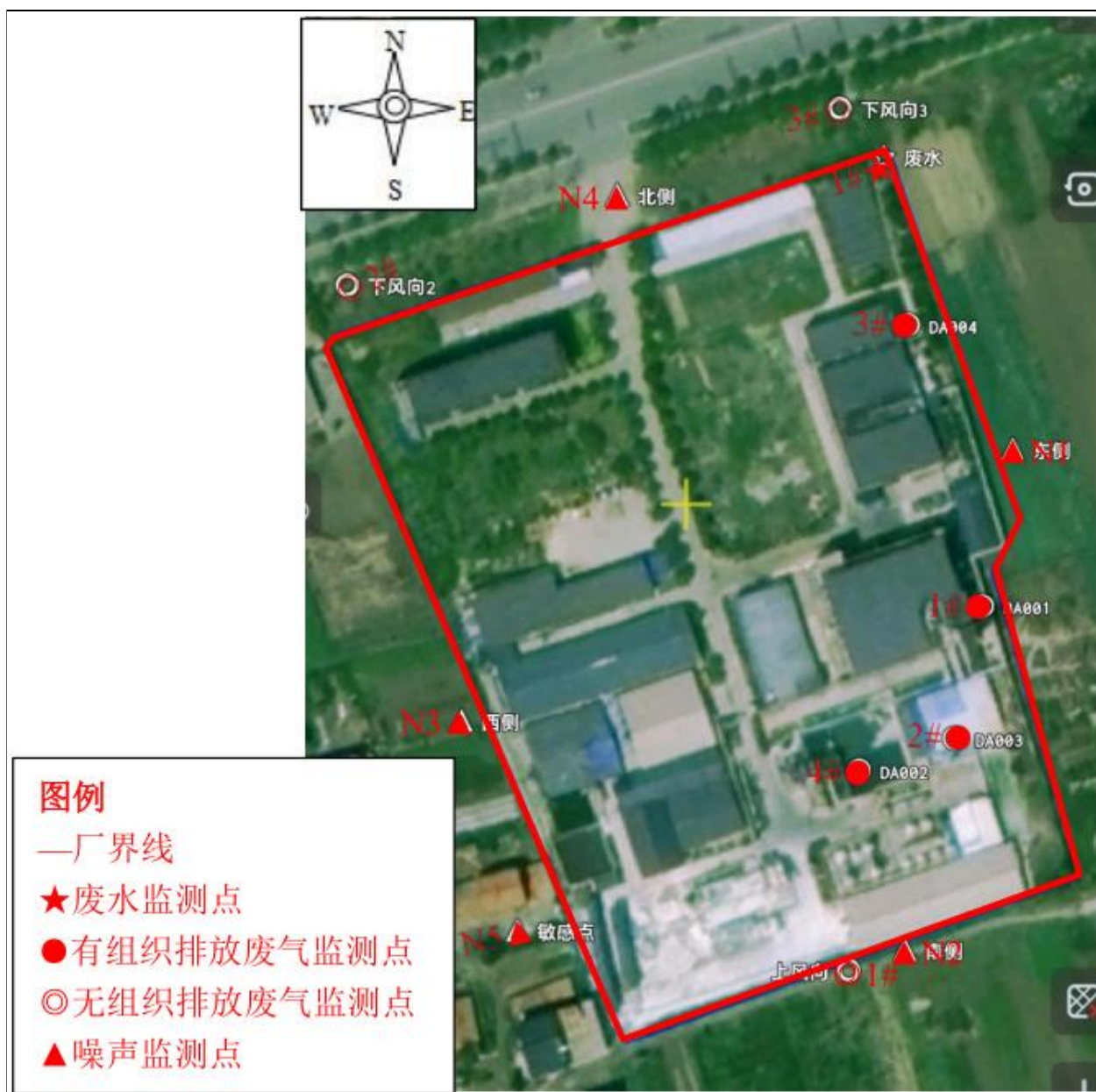
附图 5 项目验收监测点位图