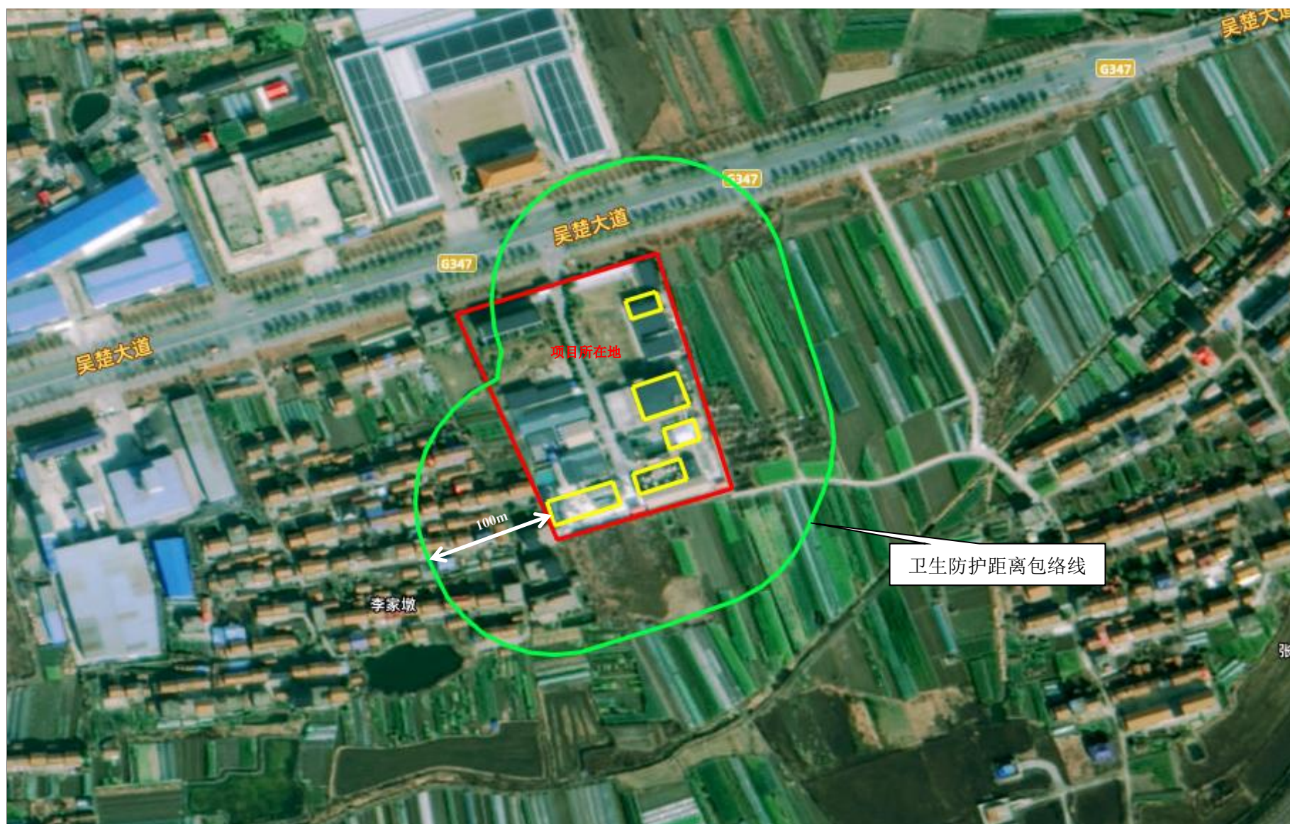
附图 6 项目卫生防护距离包络线图