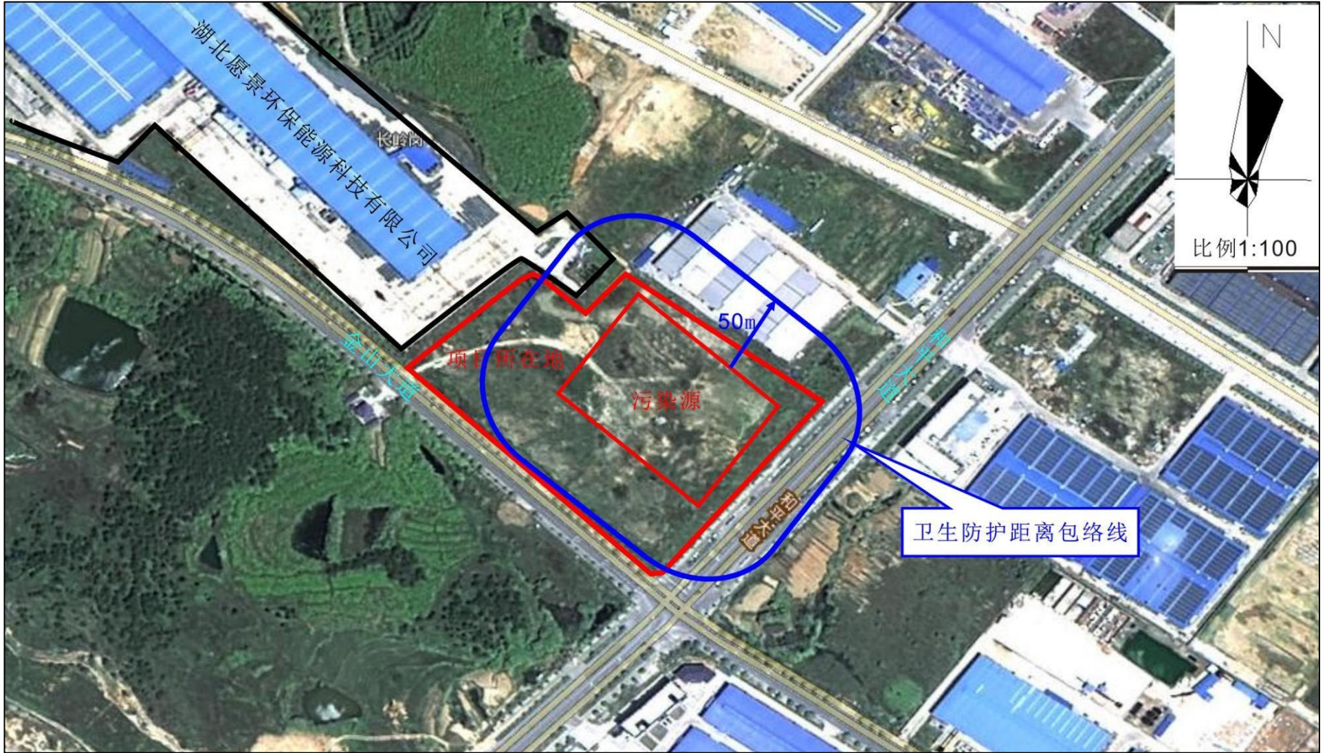
附图5 项目卫生防护距离包络线图