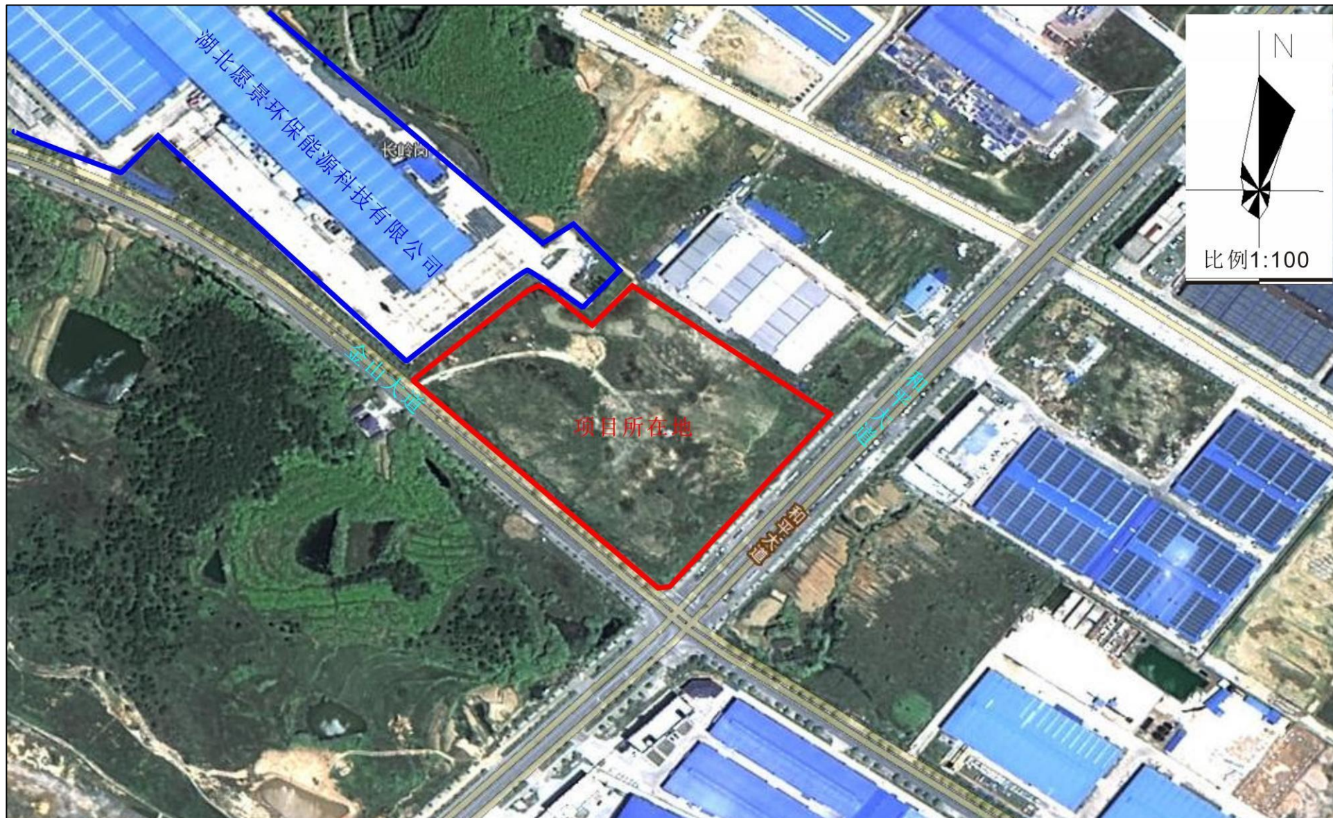
附图2 项目周边环境关系图