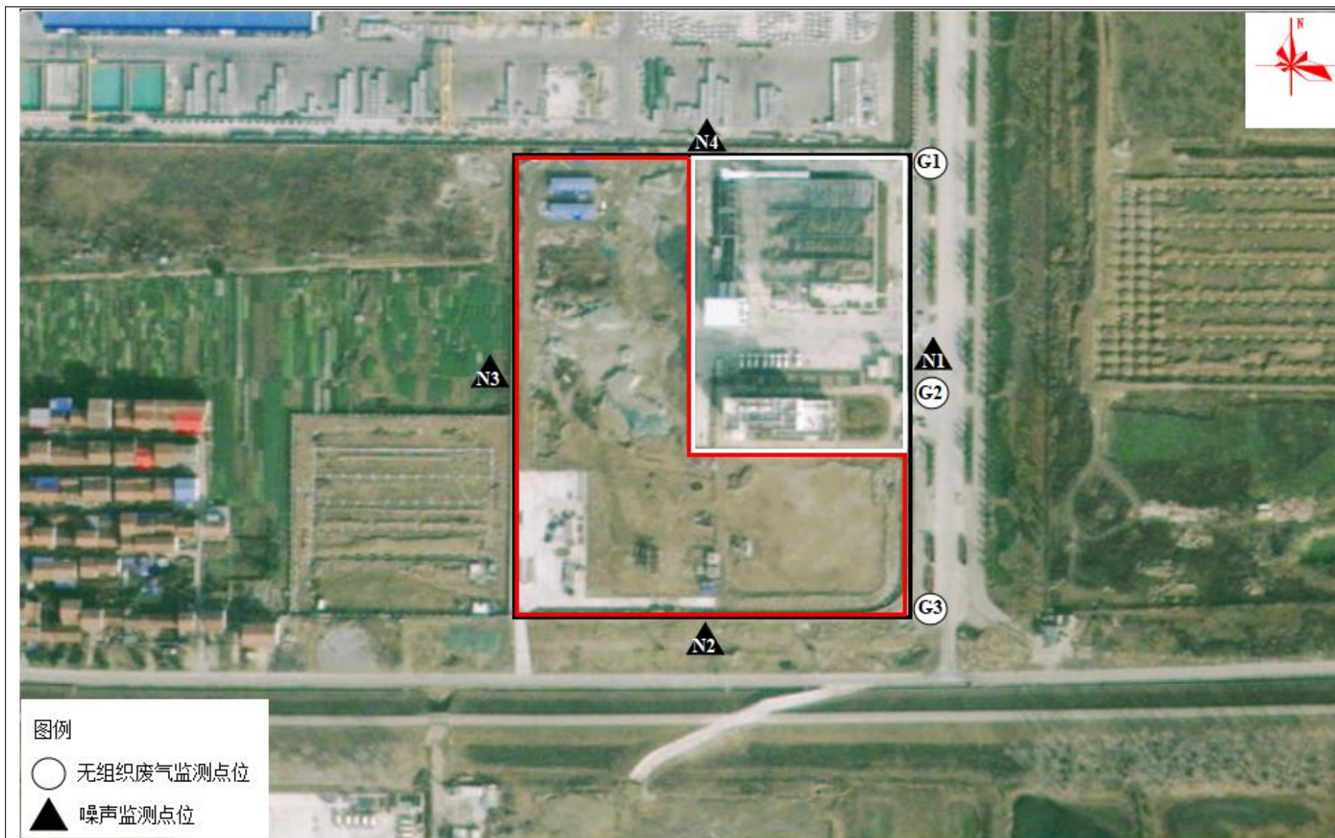
附图 4 项目验收监测点位图