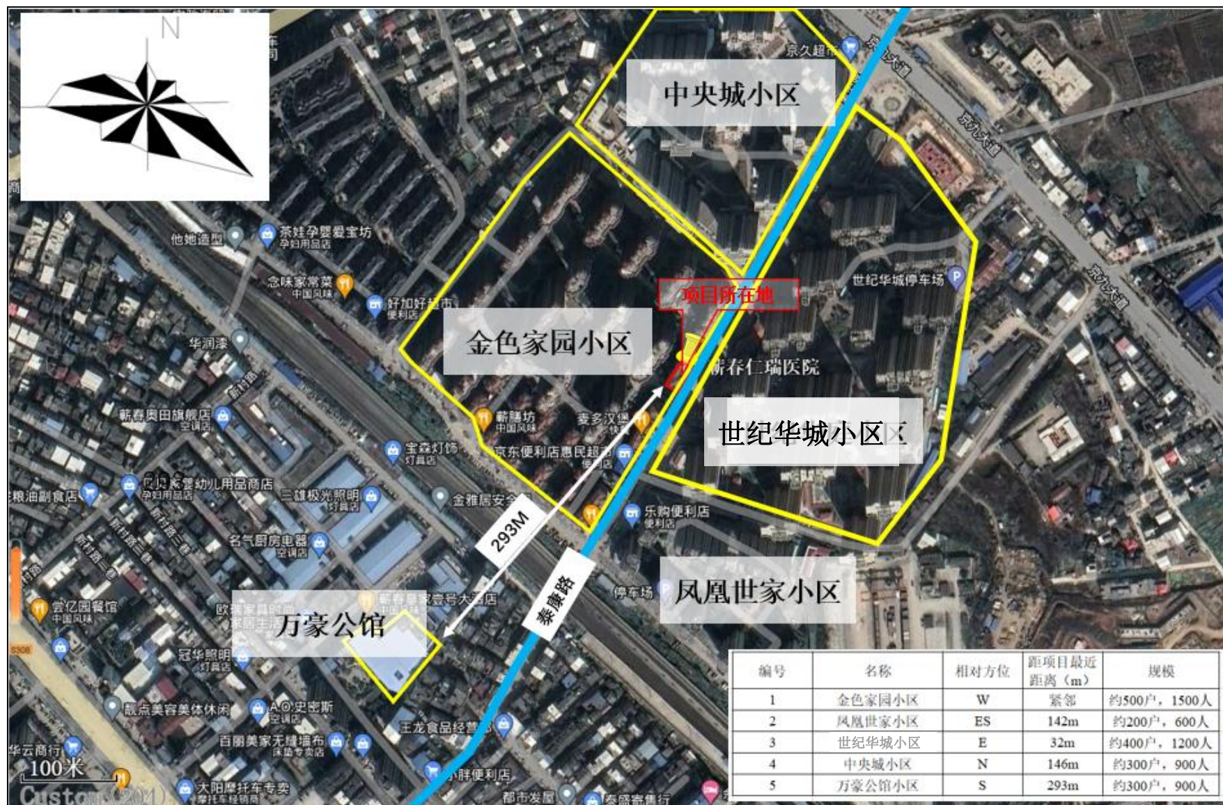
附图2 项目周边关系示意图