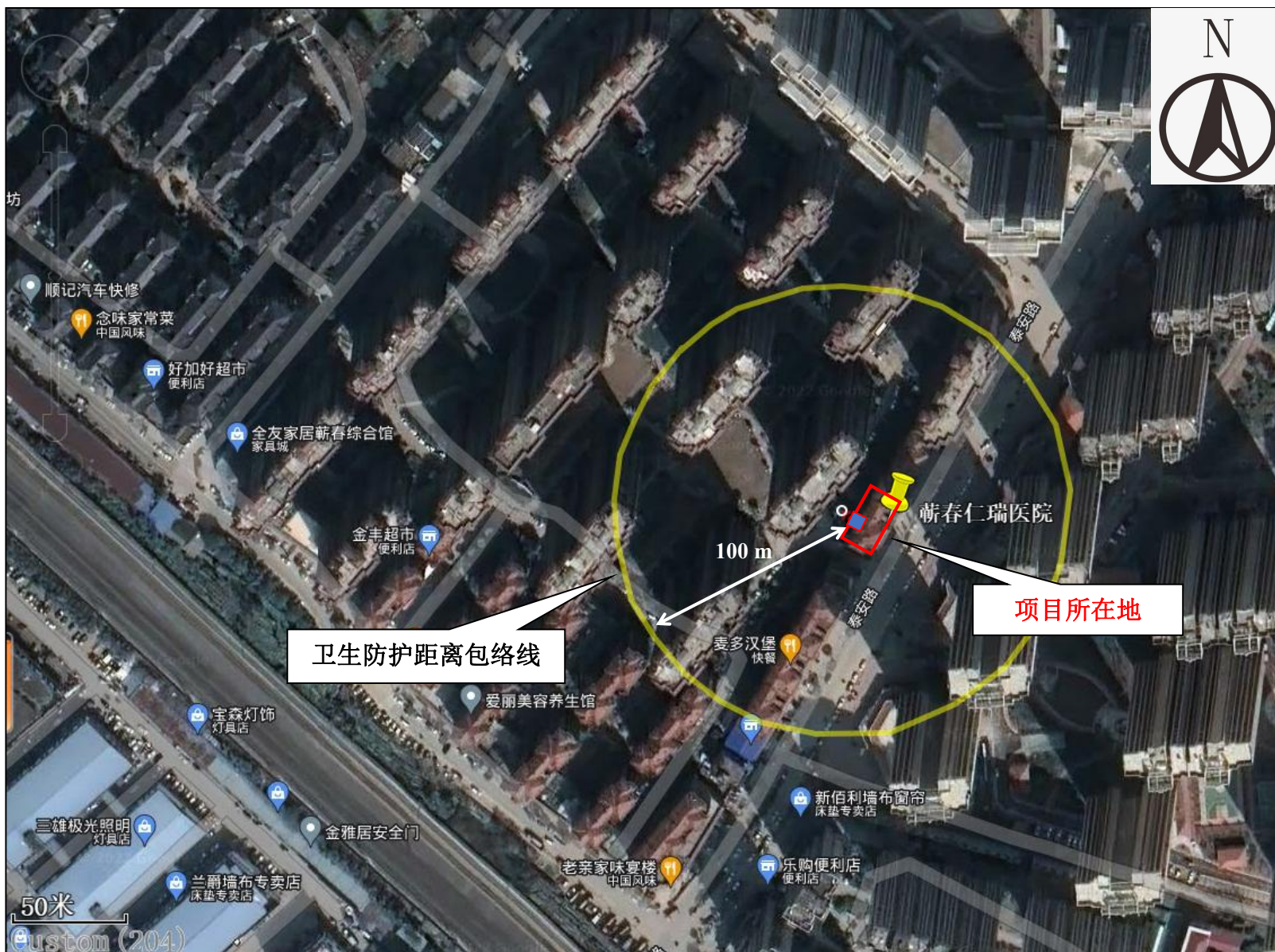
附图 5 项目卫生防护距离包络线图