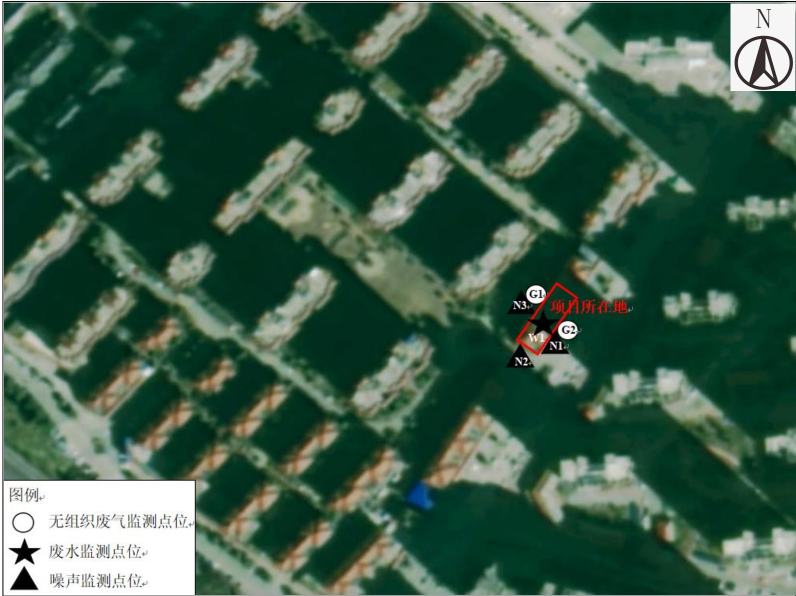
附图 4 项目监测点位图