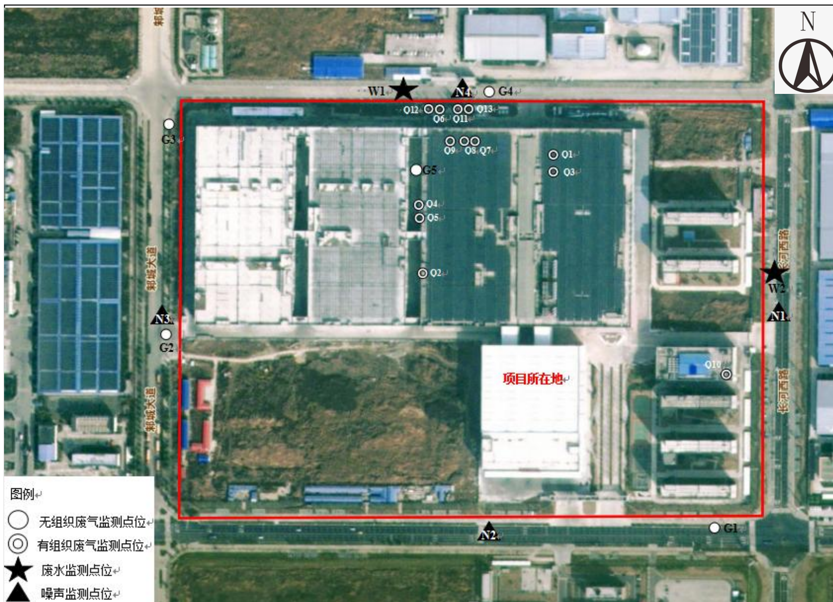
附图 5 项目监测点位图