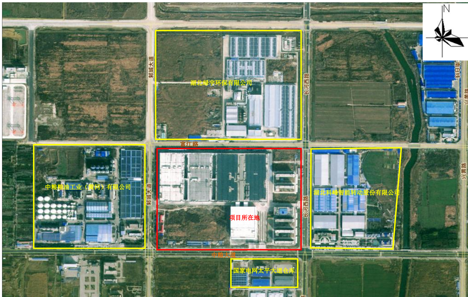
附图 2 项目周边关系示意图