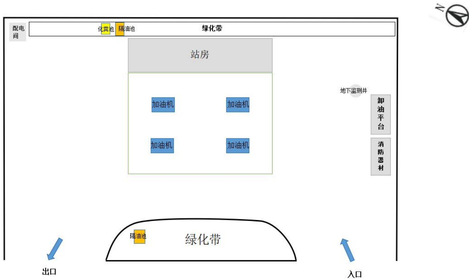
附图 3 项目平面布置图