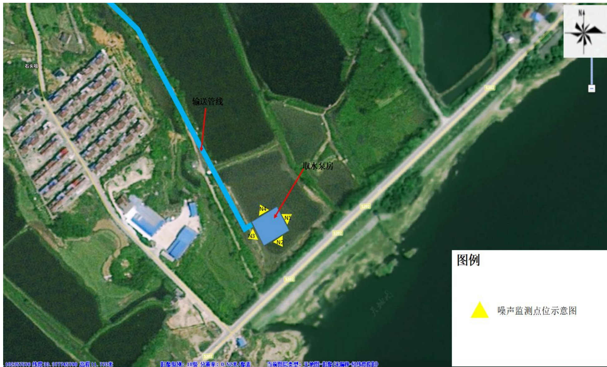
附图6 项目验收监测点位示意图