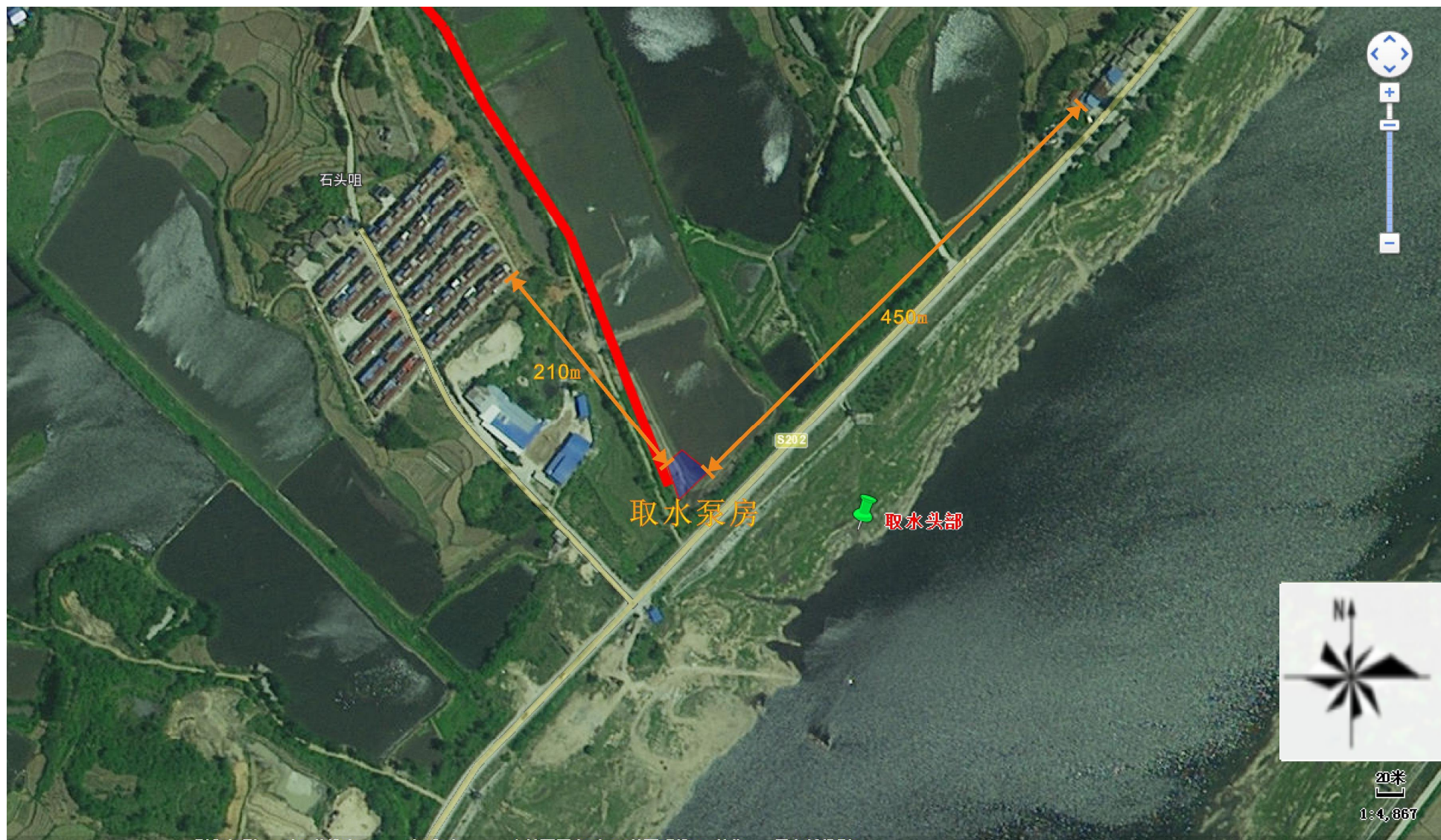
附图3 项目取水泵房周边环境关系图